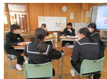
班ごとで話し合い、意見を発表