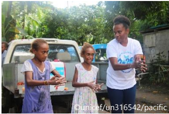
正しい手洗いの実演をするハツ又アの子 どもたち (2020年4月1日撮影)

ユニセフ活動も身動きできない状態ですが、日本ユニセフ協会のホームページを閲覧したり、ユニセフニュースで紹介された本を読んだり、今までよりむしろ深くユニセフについて学んでいます。