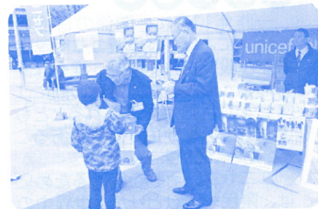
1周年企画・岐阜駅北口前広場