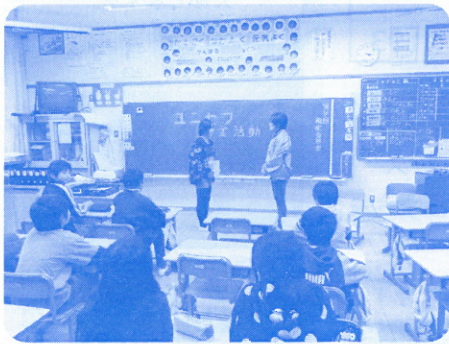
海津市立石津小学校