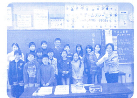
穂積市立南小学校