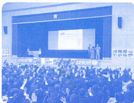
碧南市立大浜小学校