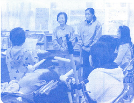
岐阜県立長良特別支援学校