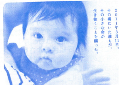
ハッピーバースデー3.11写真展

2011年3月11日。 その場にいた誰もが、 その小さな命が 生き抜くことを願った。