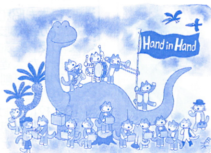
ワクチンで、守ろう小さな命。