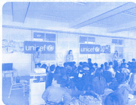
名古屋市立滝ノ水小学校