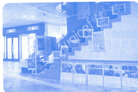
本巣市・アグネスチャン講演会に出展