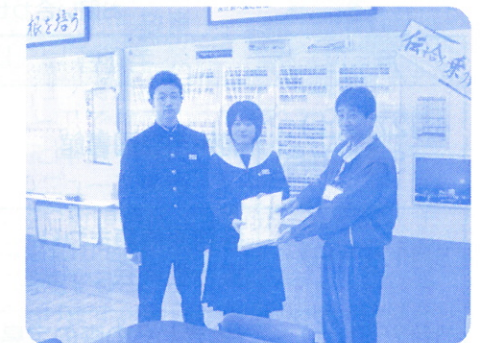
高山市立中山中学校 ハガキ受取