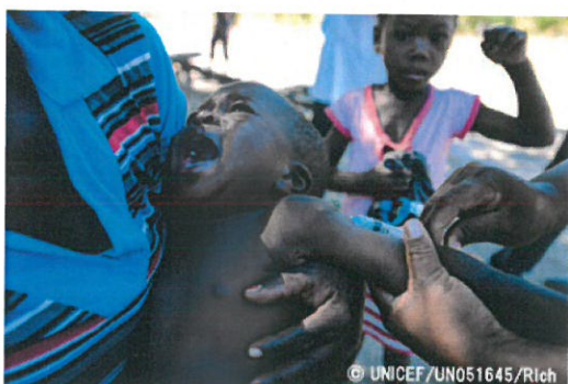
三種混合ワクチンの予防接種を受ける赤ちゃん (モザンビーク)

2016年に5歳未満で死亡した子どもの数は560万人 (1日あたり1万5,000人)で、1990年の1,260万人 (1日あたり3万5,000人)から大きく減少しました。