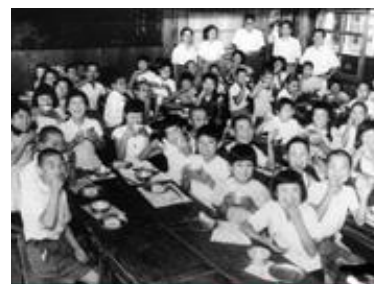
日本ユニセフ協会