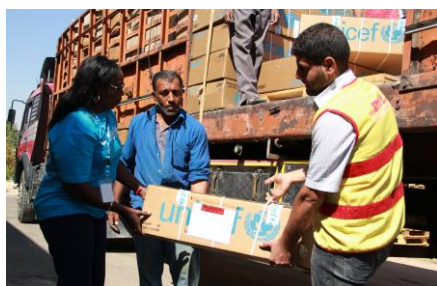
ユニセフの緊急支援物資を運ぶトラック